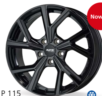
P 115 czarny 16–18 Cali