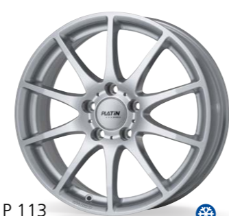
P 113 srebrny 16–18 Cali