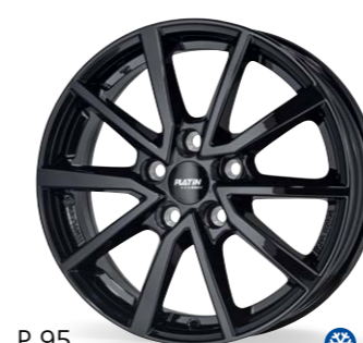
P 95 czarny 16–17 Cali