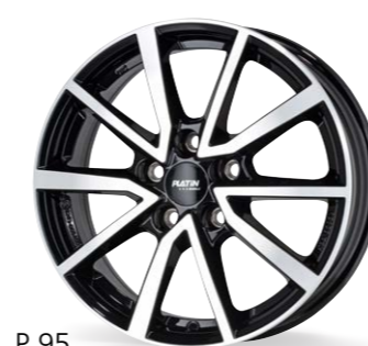
P 95 czarny, polerowany 16–17 Cali