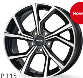
P 115 czarny, polerowany 16–18 Cali