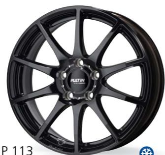
P 113 czarny 16–20 Cali