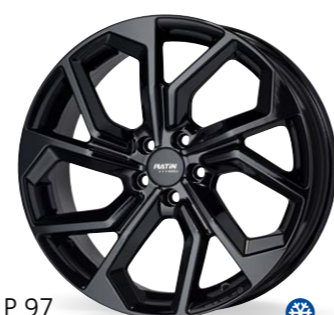
P 97 czarny 16–20 Cali