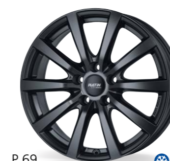
P 69 czarny matowy 15–18 Cali