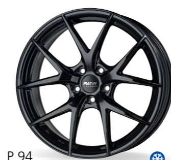
P 94 czarny 18–20 Cali