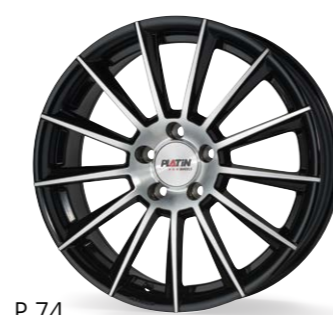
P 74 czarny, polerowany 17–19 Cali