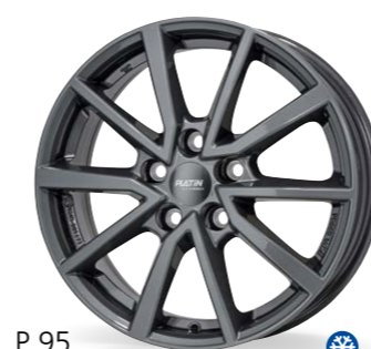
P 95 szary 16 Cali