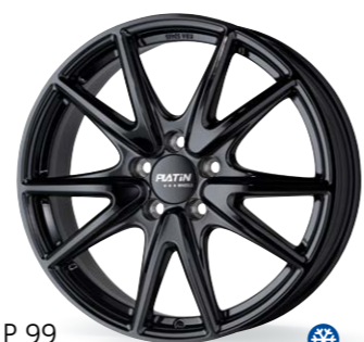
P 99 czarny 17–19 Cali