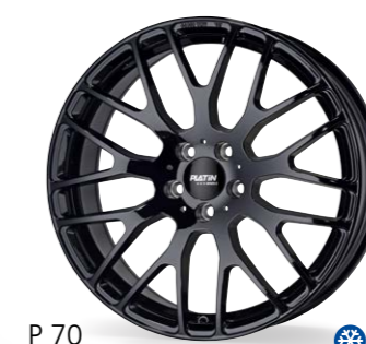
P 70 czarny 17–21 Cali