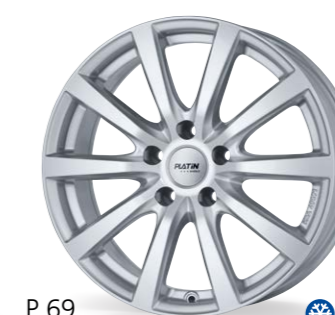
P 69 srebrny 15–18 Cali

❄️ Te felgi są odpowiednie do użytkowania zimą