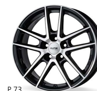
P 73 czarny, polerowany 14–18 Cali