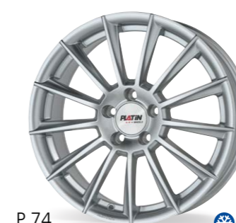
P 74 srebrny 17–19 Cali