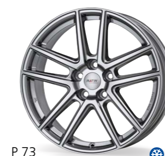
P 73 srebrny metaliczny 18–19 Cali