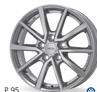
P 95 srebrny metaliczny 16–17 Cali